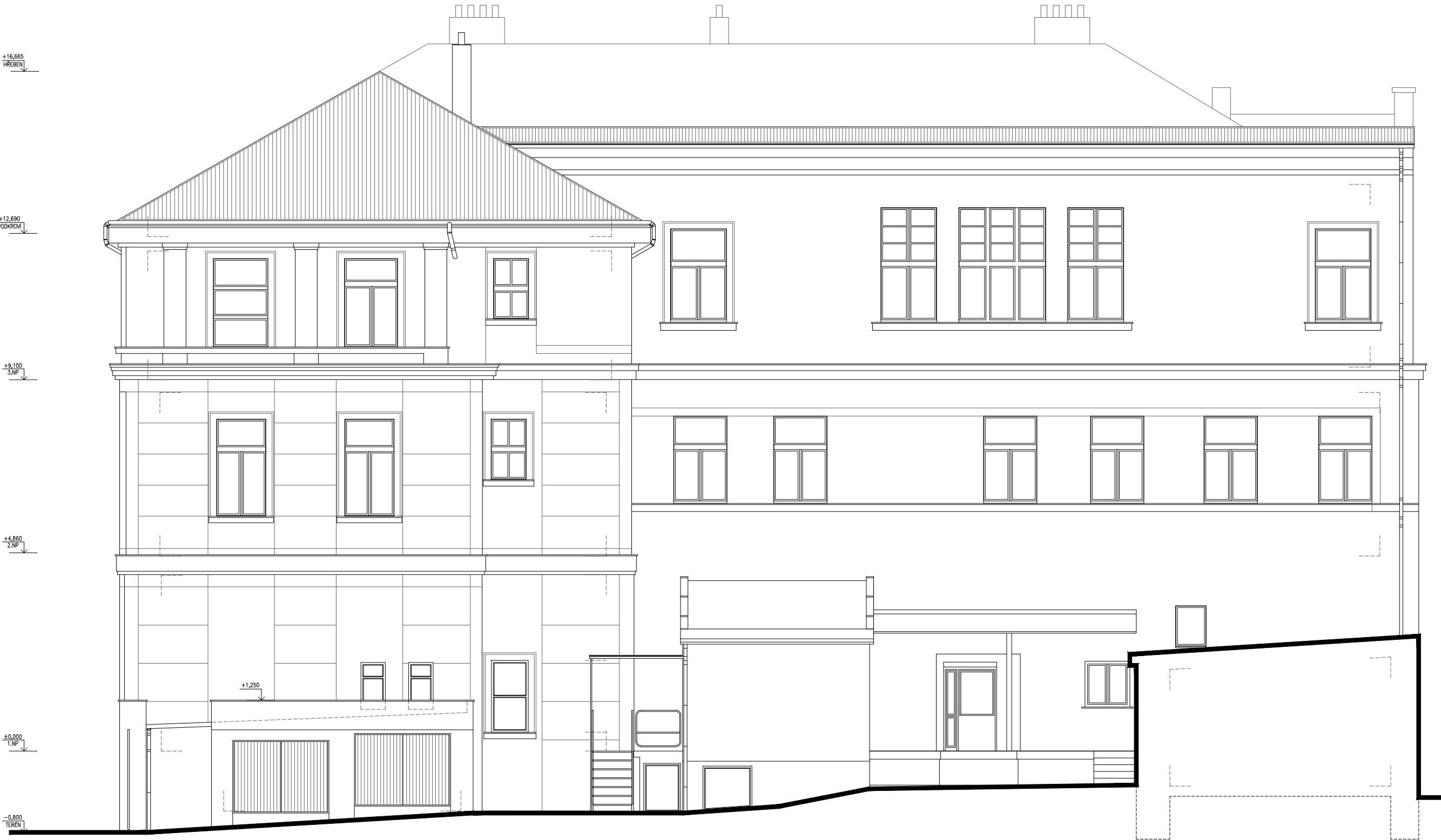
POHLED 3 – SEVEROVÝCHODNÍ (DVORNÍ) FASÁDA